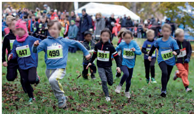
Waldsträßer Crosslauf: Auch für Kinder ein spannendes Erlebnis

Für Verpflegung ist gesorgt. Bitte helft aber mit, die Müllmenge zu reduzieren. Bringt deshalb möglichst eigene Tassen/Becher, Teller und Besteck zur Veranstaltung mit. Besten Dank!